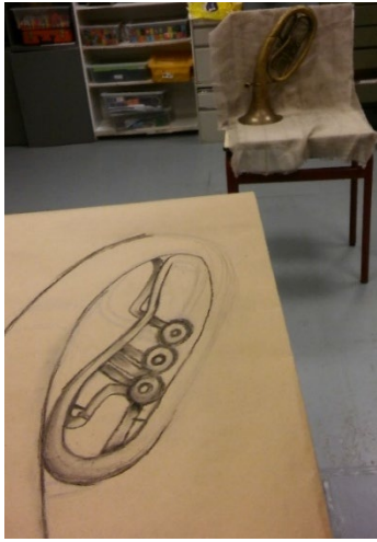
Anastasija, 5. klase