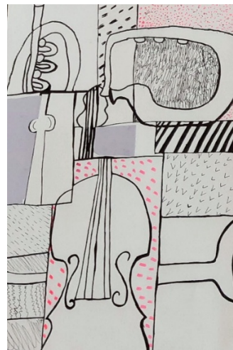
Elīna, 5. klase