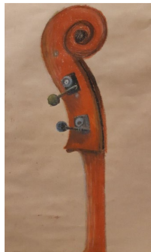
Anastasija, 5. klase