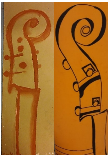
Marta, 5. klase