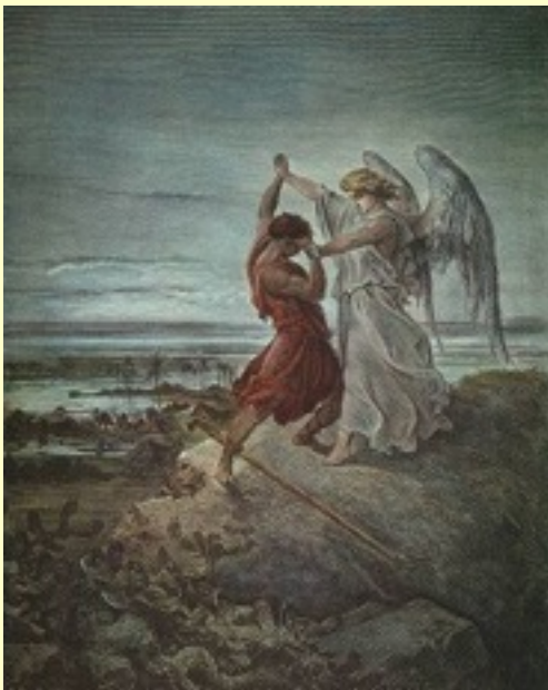
Jacob Wrestling with the Angel

Par ebreju tautas reālo pamatlicēju uzskata Ābrama mazdēlu Jēkabu , kas, pierādot savu spēkā cīņā ar Dieva sūtītu eņģeli, iemanto iesauku " Israels " – no senebreju val. – " cilvēks, kas cīnījies ar pašu Dievu ". Tāpēc Jēkaba dzimtu sāka dēvēt par „Israēla tautu”, bet viņu apdzīvoto zemi – par Israēla zemi.