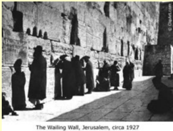
The Wailing Wall, Jerusalem, circa 1927

Pēc ebreju atgriešanās no Babilonijas gūsta, valdnieka Josijas īstenotās reformas 621. g. p. m. ē. centralizē Jahves kultu.